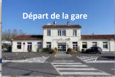
Départ de la gare