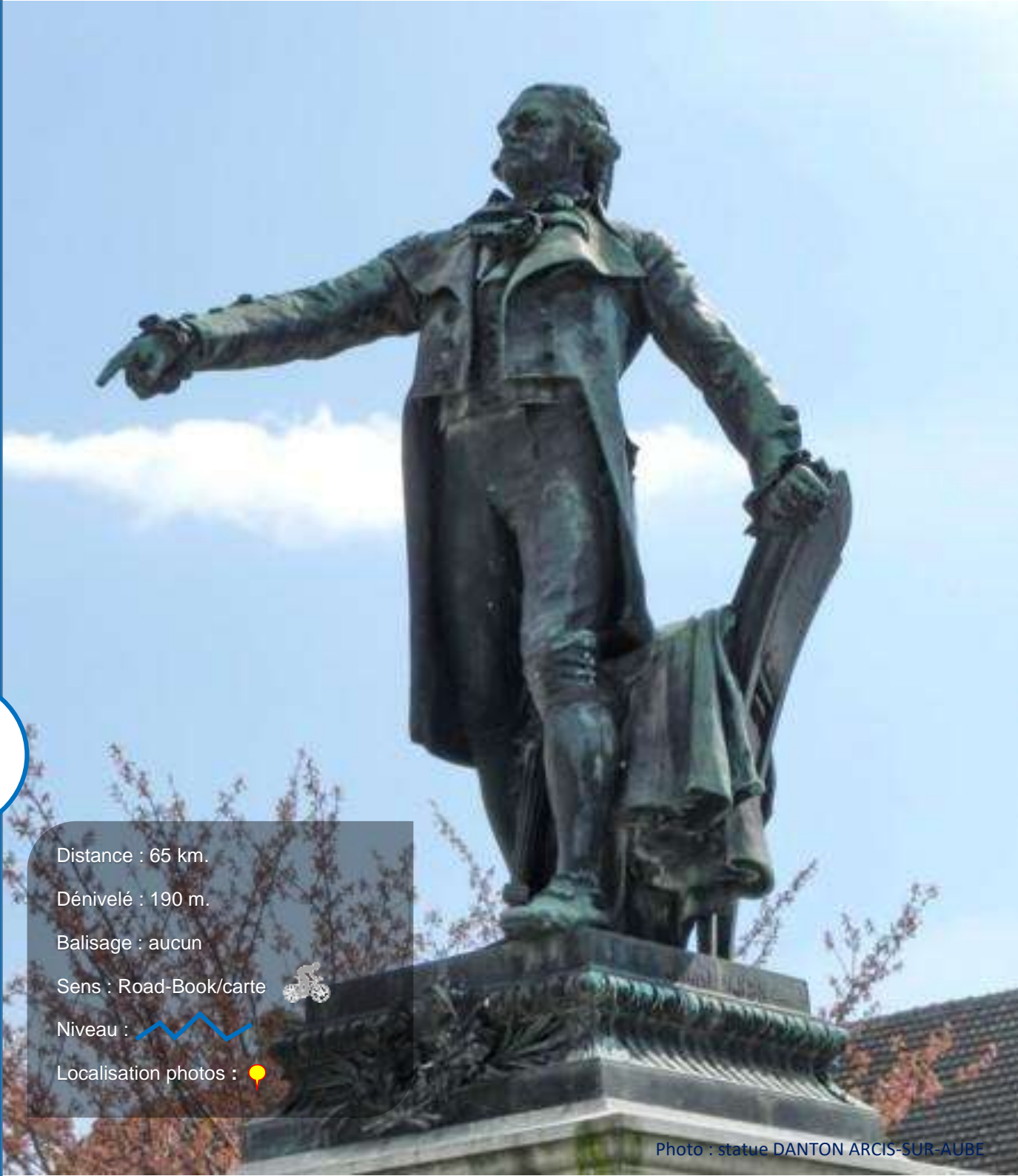
Photo : statue DANTON ARCIS-SUR-AUBE