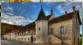
Départ du marché couvert